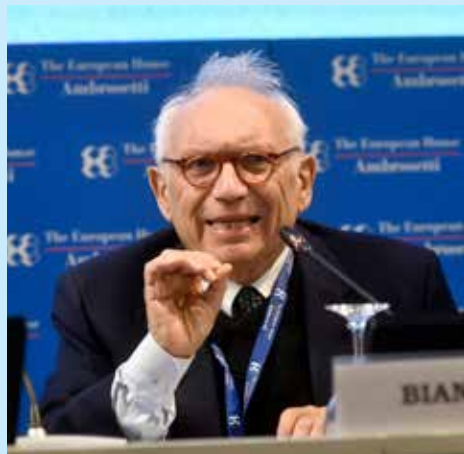
■ Patrizio Bianchi

li o che possono sviluppare la malattia in modo grave. Queste dovranno tenere la mascherina ma non potranno restare a