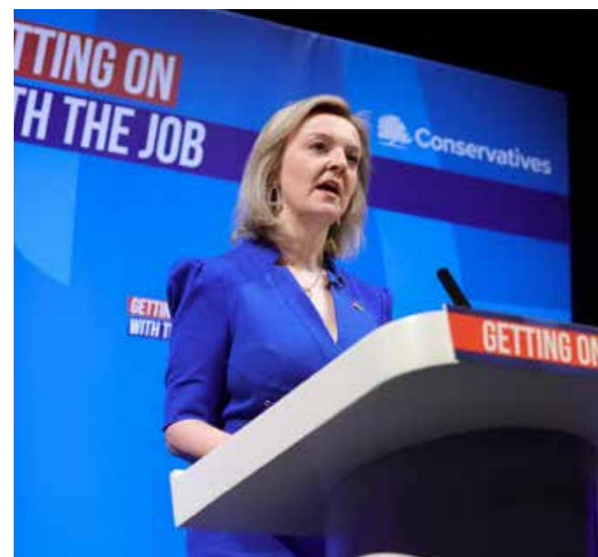
■ Liz Truss

Oggi giura l'erede di Johnson Ha già chiarito che continuerà il programma del suo predecessore