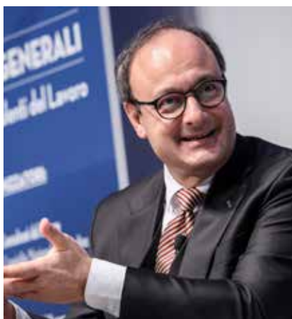
■ Antonello Giannelli