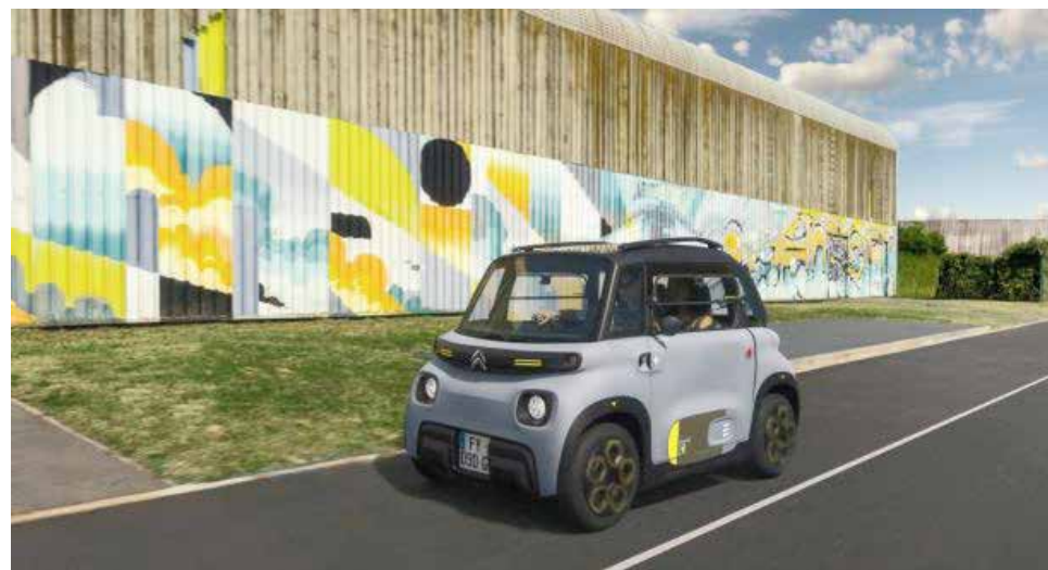
■ La Citroën My Ami Tonic

immagine. "L'equipe Citroën Design ha voluto dare un tocco di freschezza e vitalità a questa nuova versione. L'abbinamento tra blocchi di colore giallo limone e khaki, associato a pratici elementi tecnici (personalizzazioni a forma di punta di freccia) conferisce a My Ami Tonic un aspetto ludico rendendola un giocattolo per adulti di età compresa fra i 14 e i 77 anni" dichiara Mathieu Wandon, Responsabile Design Grafico di Citroën. Citroën Ami è un vero e proprio fenomeno sociale che risponde alle nuove aspirazioni di mobilità per gli spostamenti quotidiani perché è elettrico, accessibile, comodo e sicuro, senza stress e si guida senza patente (è sufficiente il patentino AM). Innovativo nella risposta moderna che offre alle esigenze dei clienti di tutte le età, si distingue per il suo carattere unico che lo differenzia dalle offerte tradizionali del mercato. Guidare Ami è rivendicare un modo di affrontare la mobilità in maniera diversa, totalmente rilassata e divertente. Il suo stile è unico e allegro, dall'aspetto accattivante.