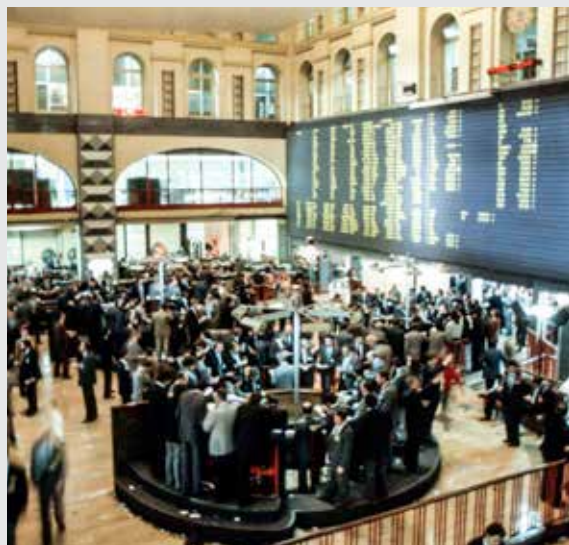
Piazza Affari (imagoeconomica)

La settimana è iniziata nel modo peggiore per le Borse europee, che ieri hanno finito in netto calo, pur se sopra i minimi (Milano -2,01%, Parigi -1,2%, Francoforte -2,2%, Londra +0,09% dopo che si è sbloccata la partita per la nuova premiership, Madrid -0,97% e Amsterdam -0,66%). A spaventare gli investitori sono stati i nuovi lockdown in Cina, l'assenza del faro di Wall Street, chiusa per il Labor Day, e soprattutto la crisi del gas, con i prezzi in rialzo fino al 25% a 284 euro al megawattora, per poi tornare nel finale a 247 euro (+15%), dopo il nuovo stop alle forniture russe attraverso il Nord Stream 1. Questo ha innescato vendite su varie asset class, spingendo l'euro ai minimi da 20 anni sul dollaro (è sceso sotto i 99 centesimi per poi riportarsi a 0,992). Sull'azionario i settori più penalizzati sono stati quello delle auto, dell'industria e delle banche (in attesa delle decisioni della Bce sui tassi di giovedì). Bene a Piazza Affari Eni (+1,69%) e Tenaris (+0,92%), in coda Stellantis (-4,79%), Pirelli (-5,06%) e Interpump (-4,82%).