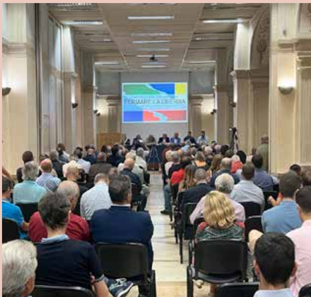
■ L'evento "Fermare la guerra, salvare l'Italia"