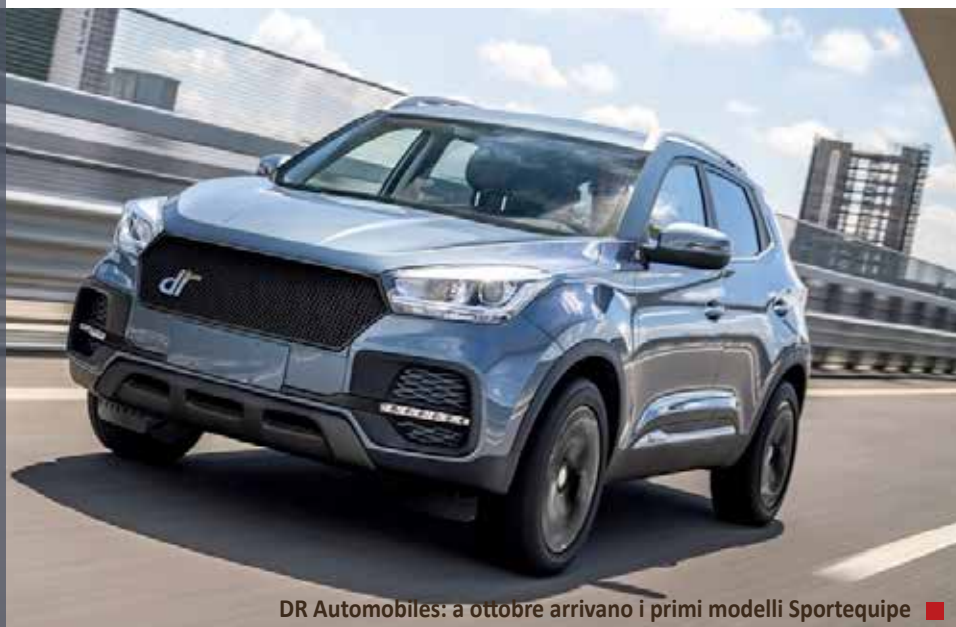
DR Automobiles: a ottobre arrivano i primi modelli Sportequipe ■